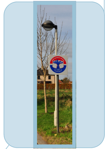
Waar wordt het vaakst ingebroken?